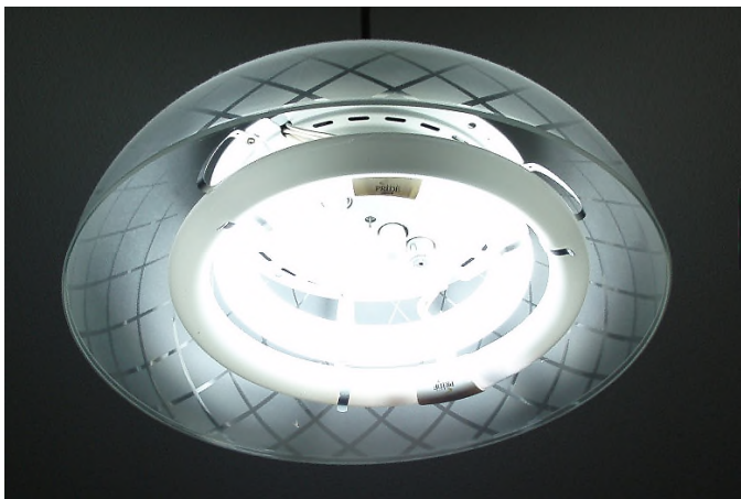
切れた電球の球は何年も、切れていた