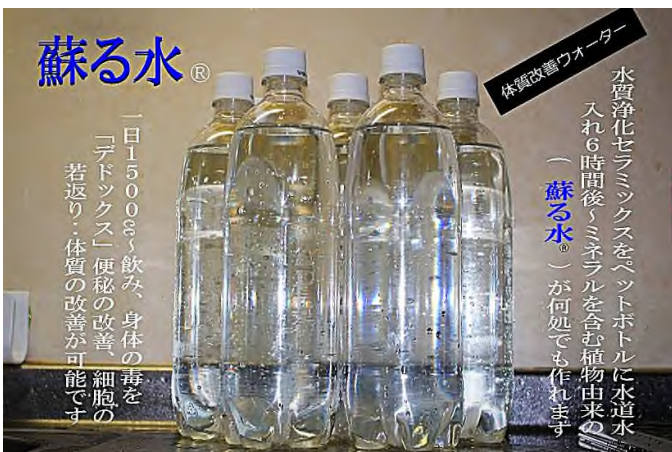
蘇る水の中には電子が含有 酸化結合分解洗浄