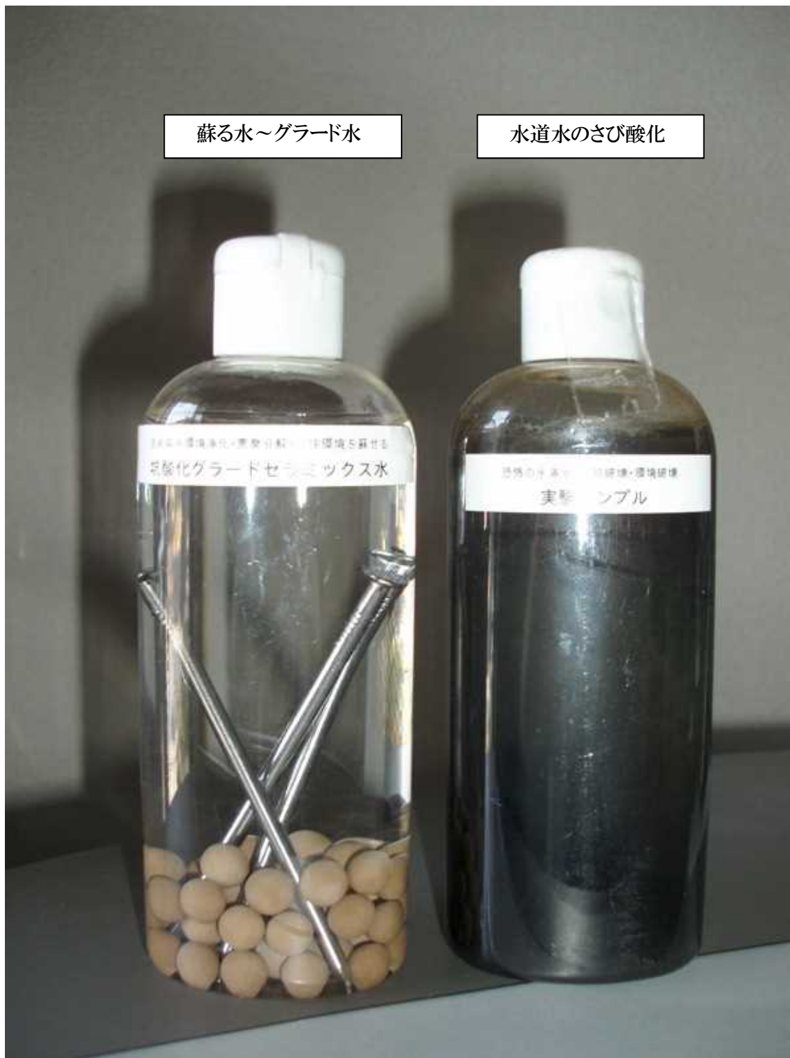
水道水のさび酸化